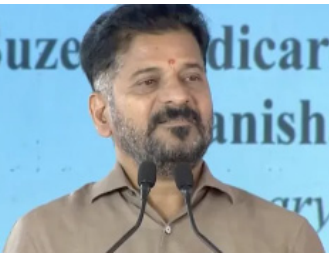
ప్రభుత్వ ప్రణాళికలు ఉన్నాయి. ప్రపంచ స్థాయి చేశాలతో తెలంగాణ పోటీపడేందుకు ప్రభుత్వం కృషి చేస్తోంది. పెట్టుబడులకు అనుకూలమైన వాతావరణం మన రాష్ట్రంలో ఉంది. పెద్ద కంపెనీలకు నీటిబోమ్మగా ఉన్నది మన చేత కాక... అని నీటి బోమ్మ అన్నారు.

ప్రపంచ సగరాలతో పోటీ... ప్రపంచ సగరాలతో హైదరాబాద్ పోటీ పడుతోంది. సుజెన్ మెడికల్ నిరుద్యోగ యువతకు ఉపాధి కల్పిస్తోంది. పెట్టుబడులకు లాభం వచ్చేలా